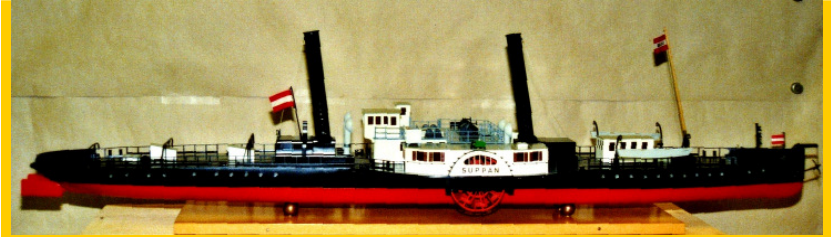
Einer seiner Stars: Der SUPPAN, ein Rad-Schleppschiff der DDSG