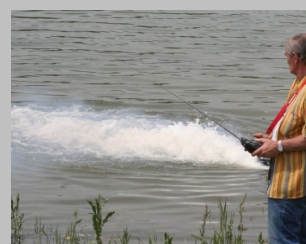
Was der so alles r'auslässt?!