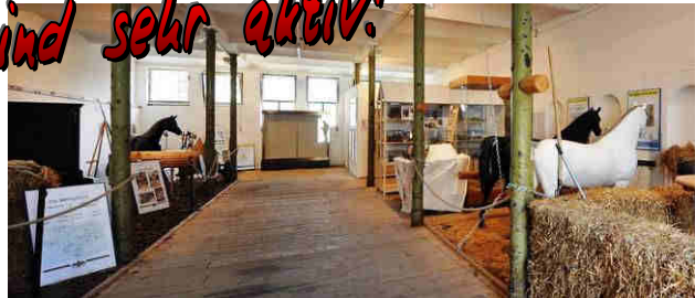
▲ Die schöne Halle: Wir waren vor allem links u. rechts hinten im Einsatz!

Wir sind jetzt gerade dabei unsere bisherigen Lager- und Ausstellungsstücke, die in der renovierten Stallhalle in der VPW-Kaserne in Hütteldorf standen, in unser DOPPELADLER | MODELL-LOKAL zu überführen.