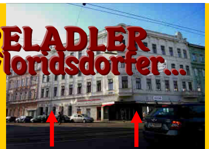
Unsere beiden Lokalitäten sind hier