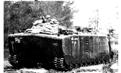
LVTP-5 „AMTRAC“ (Landing Vehicle Tracked Personnel) = Amphibischer leicht gepanzerter Truppentransporter des US Marine Corps.

Die Aufschrift über dem Merry-Christmas-Schriftzug ist vietnamesisch und lautet: Đáp ứng mọi người trên trái đất có thiện chí = „Friede den Menschen auf Erden, die guten Willens sind“