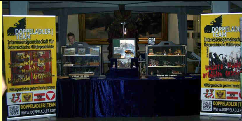
Unser Stand am Eingang zum Marinesaal

11., 12. und 13. März 2016 WUNDERWELT MODELLBAU im VAZ, St. Pölten