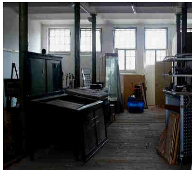
Restaurierbare alte Vitrinen in Arbeit...