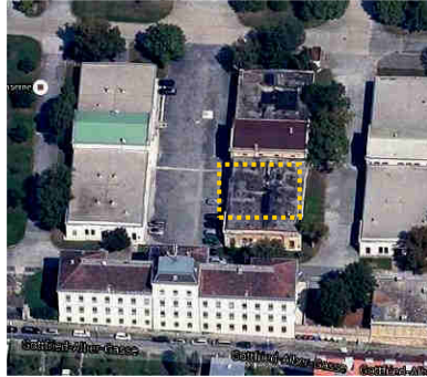
Hier ist unser Museums-Stall