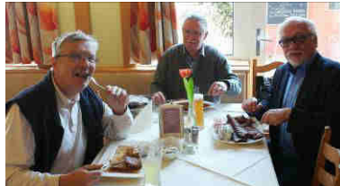
.. und außerdem gibt es zwei köstliche Lokale in der Gegend, die wir auch gerne besuchen um Kraft zu tanken ☺ .