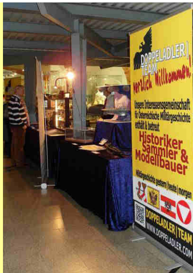
Eingang Marinesaal HGM. Hier waren vor allem k.(u.)k. Modelle und Dioramen ausgestellt und wurden bewundert...