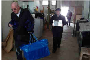
... und unsere Freunde in Arbeit