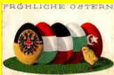
100 Jahre alte Originalkarte aus unserem Archiv

Wir wünschen Frohe Ostern und einen schönen Frühlingsbeginn