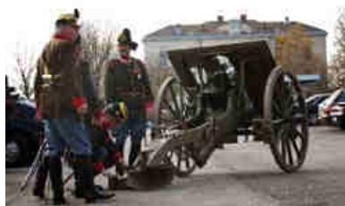
Unsere Nachbarn: Die Freunde der RAD2