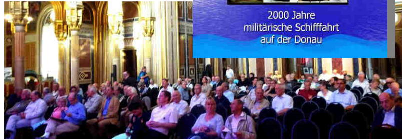
Die volle HGM-Ruhmeshalle