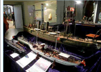
S.M.S. DALMAT, SMUs 5 und 14, S.M. Kreuzer ZENTA 1900.

Die Modelle von Ernst sind jedenfalls sehenswert! Seine Modelle waren auch schon bei unseren Ausstellungen im Einsatz. Siehe oben