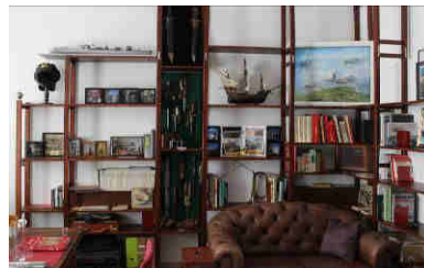
Mehr darüber auf Seite 3 >>>

Wir sind gerade dabei, die beiden Haupträume für die Einlagerung der Archivartikel auszustatten. Bisher haben wir einmal die Regale soweit ausgebaut, damit wir die Räume so gut wie möglich verplanen und einrichten können.