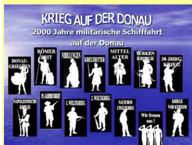
Themenmotive des Vortrages

Bis bald, bei einer unser Aktivitäten. Euer