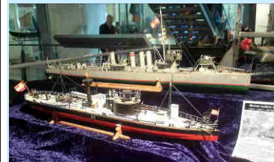
S.M. Monitor LEITHA und S.M.S. TRIGLAV

museum@dolomitenfreunde.at www.dolomitenfreunde.at