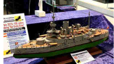
MMs historisches Modell der SMS BUDAPEST