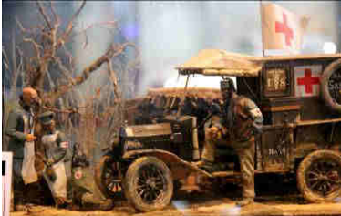
RAT – 1917. amerikanisches Sanitätsfahrzeug in k.u.k. Dienst an der Isonzo-Front