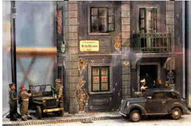
RAT – Die 4 im Jeep in Wien 1945 (70 Jahre)