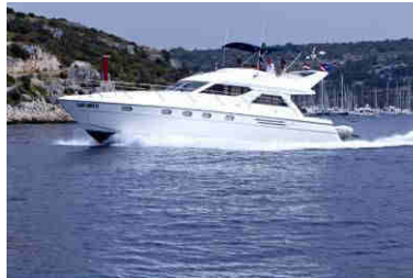
Die Reisen finden auf Luxus-Yachten mit 15 bis 20 Metern Länge statt.

Die Gedenkreise im September ist in der Nachsaison preisgünstiger, das Wetter ist meistens ruhiger und die Besucher weit weniger, wie in der Hauptsaison.