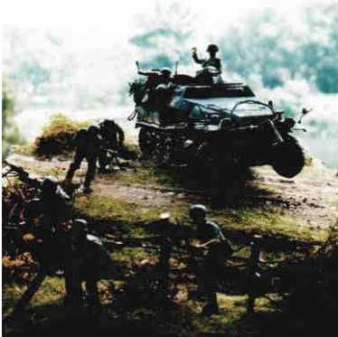
RAT – 1945. SdKfz. 251 im Einsatz