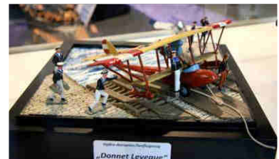
MM hat ein historisches Spielzeug-Modell des k.u.k. Flugbootes als Vignette getreu nachgebaut

Im Bild oben hält er ein faszinierendes Modell, das im 1. Weltkrieg gebaut und uns für eine Ausstellung im HGM zur Verfügung gestellt wurde.